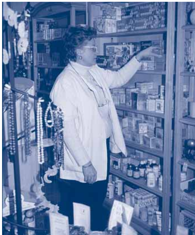
Fig. 6.11. Comerciante comprobando las existencias de mercancías de su comercio

Activo ficticio. Elementos del activo que no constituyen bienes materiales o inmateriales. Normalmente, se aplica tal denominación a aquellos gastos, amortizables en varios ejercicios, en que puede incurrir una empresa en ocasiones especiales (por ejemplo, gastos de constitución, gastos de primer establecimiento, gastos de ampliación de capital, resultados negativos de otros ejercicios pendientes de compensar, etc.). No tienen valor de realización considerados de forma aislada, ni representan derechos de cobro y, normalmente, no son transferibles a terceros.